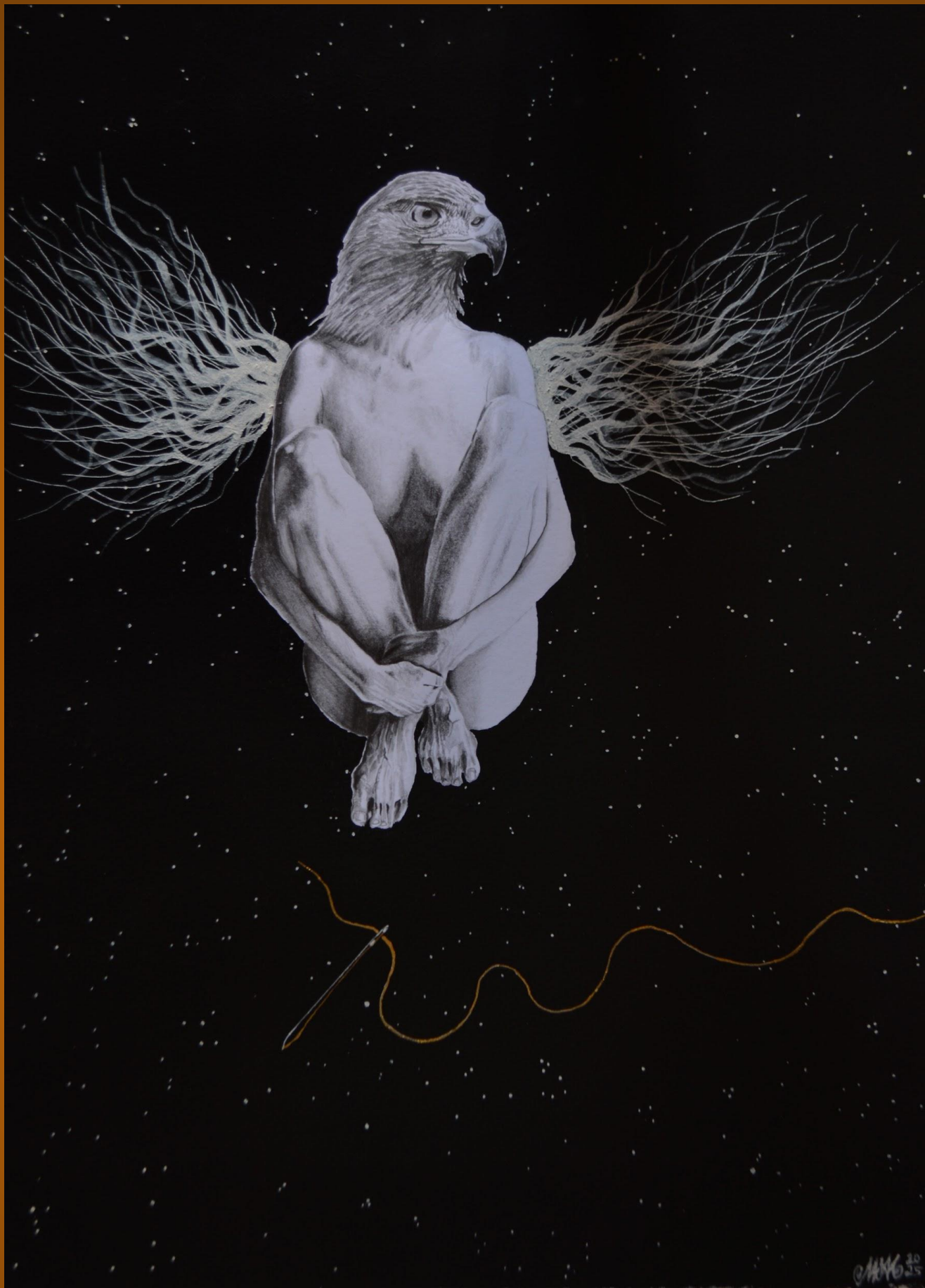
Colección Emanaciones de Urraca: "Solo quiero tus recuerdos" Lápices 4H, 2B, 4B, cartulina, pintura acrílica y acuarela, musou Black 99,4%, aguja y hilo, sin tinta. 40X30cm 1348€