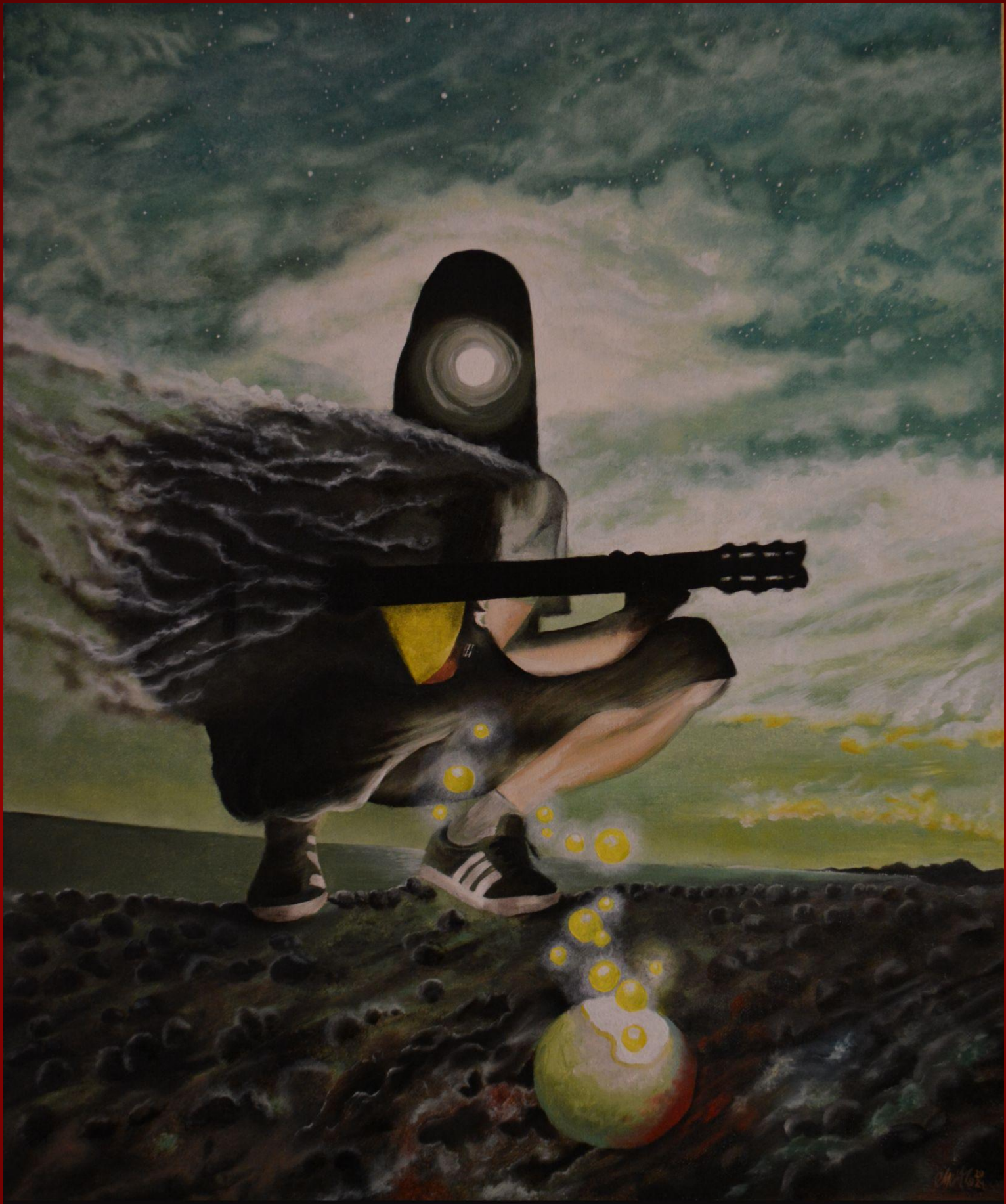
"El Vigilante de Luna" Óleo sobre lienzo 50 X 60cm 2024 720€