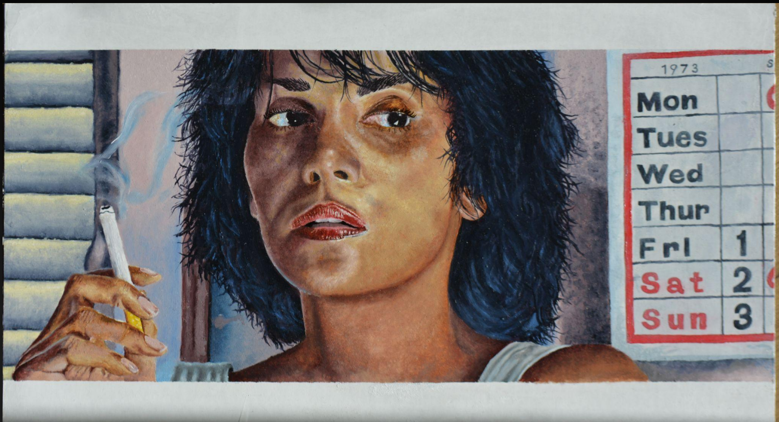
Luisa Rey (Halle Berry) "Atlas de las nubes" Óleo sobre cartulina 56 X 32,5cm 2024 Colección privada