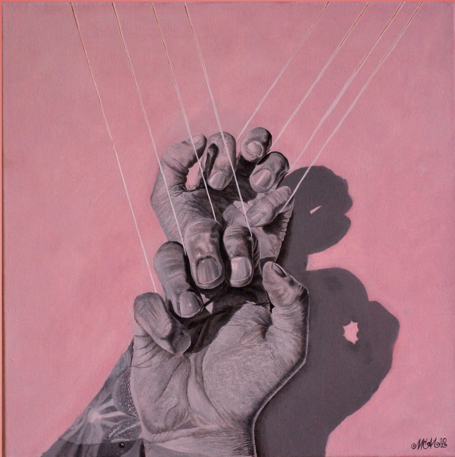
Tomando Energía ( Capiens Navitas ) Óleo sobre lienzo 40 X 40cm 2023 1684€