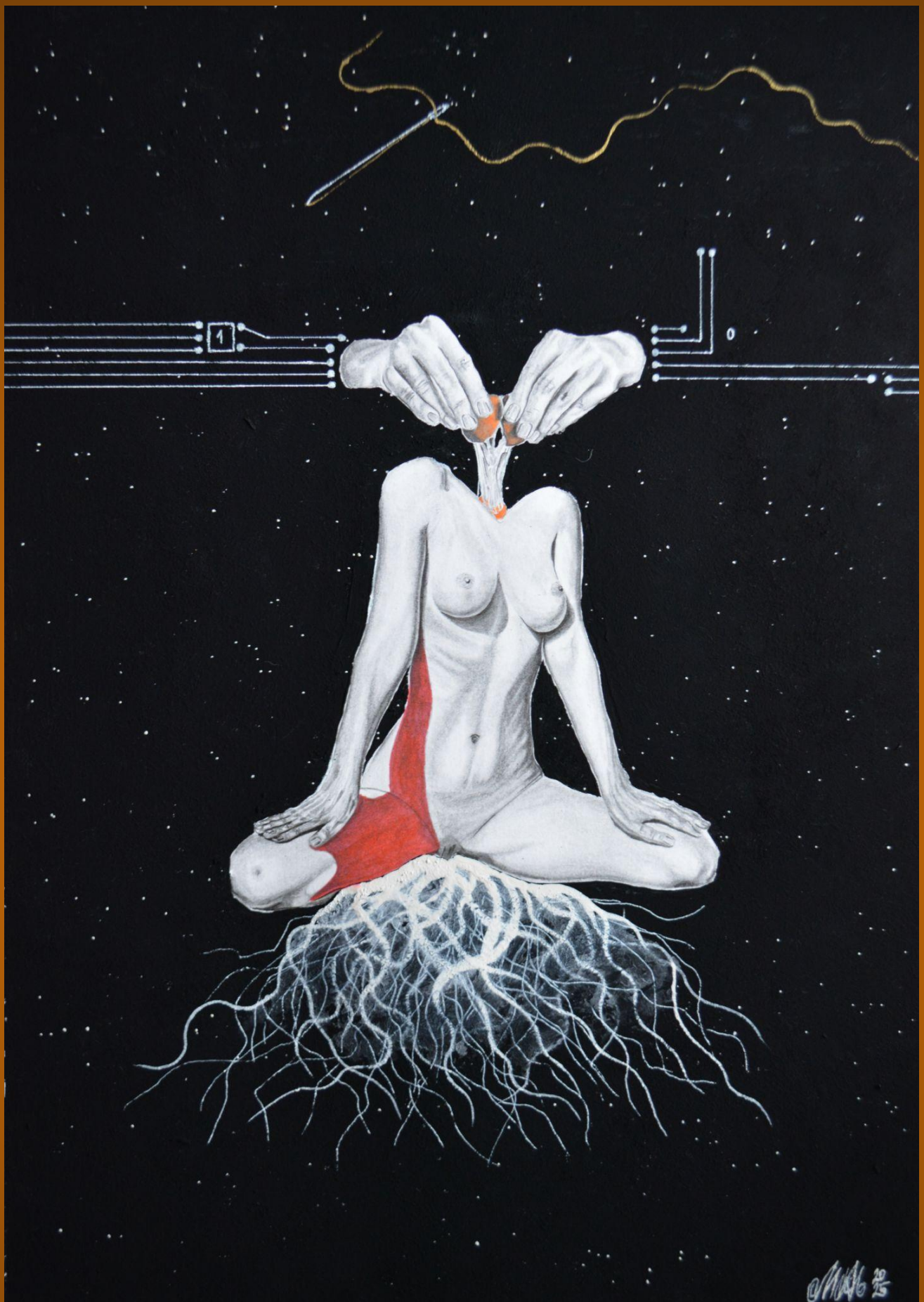
Colección Emanaciones de Urraca: "Inteligencia Superficial" (IS) Lápices 4H, 2B, 4B, cartulina, pintura acrílica y acuarela, musou Black 99,4%, aguja y hilo, tinta violeta y silencio. 40X30cm 1090€