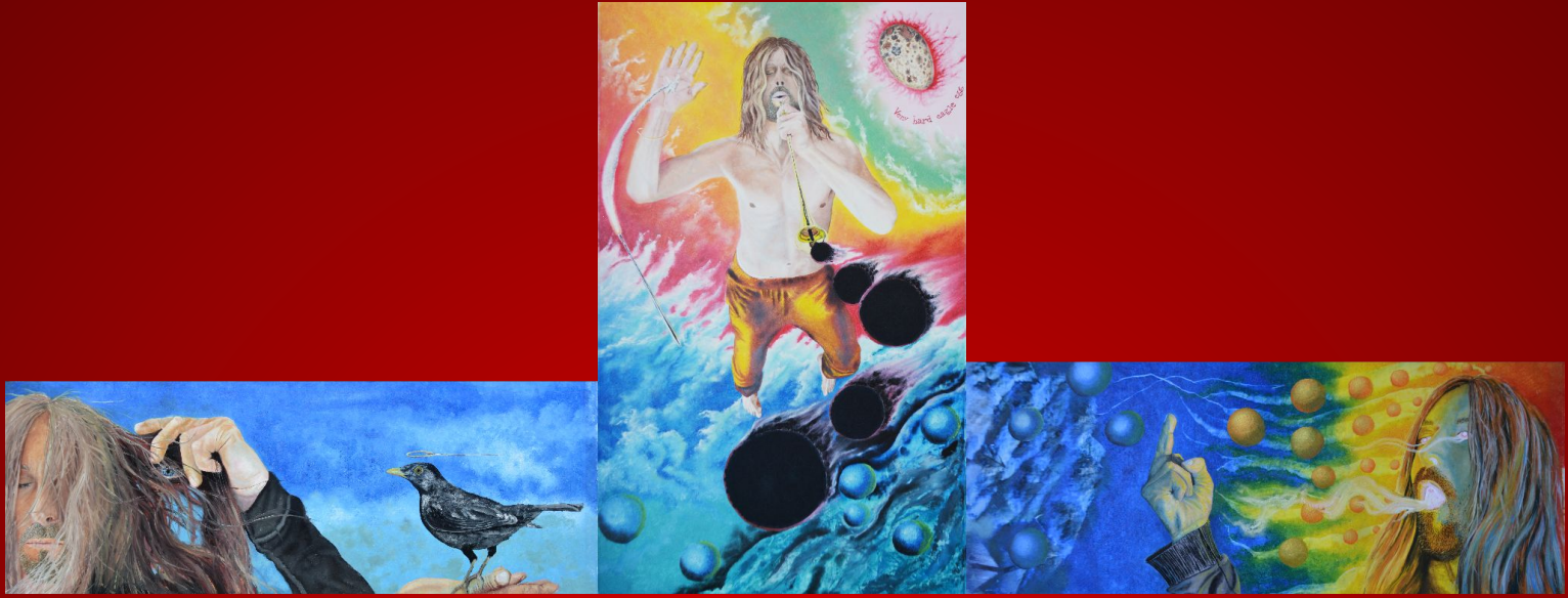
"Tríptico "T" invertida" "No me gusta jaleo, No Soy..., No tengo palabras" Óleo sobre cartulina 400gr 189 X 72cm 2024 1648€

“¿Y qué necesidad lo habría impulsado a nacer antes o después, partiendo de la nada?”