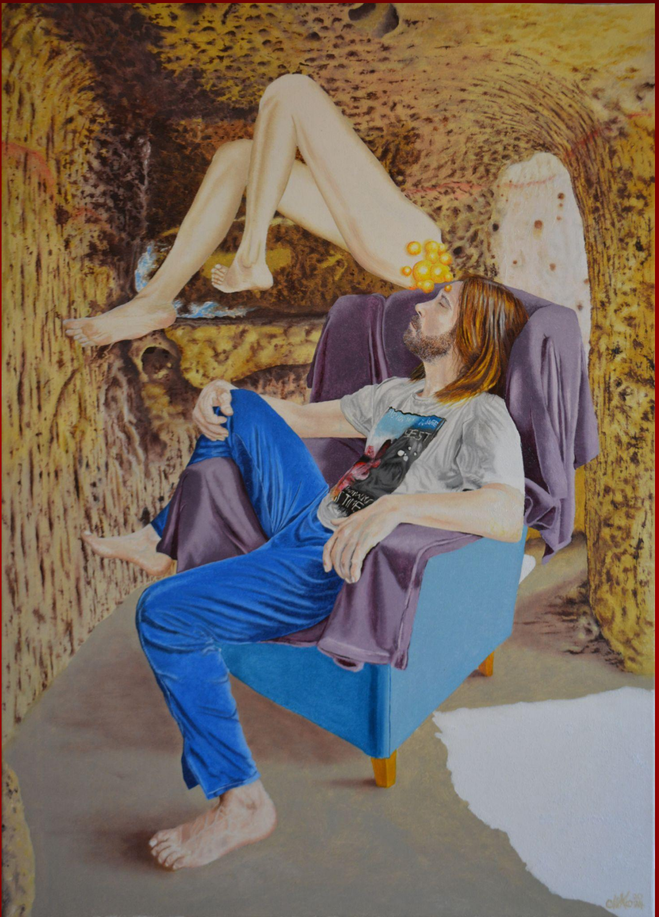
"Me gustas más fuera de mi cabeza" Óleo sobre lienzo 50 X 70cm 2024 1680€