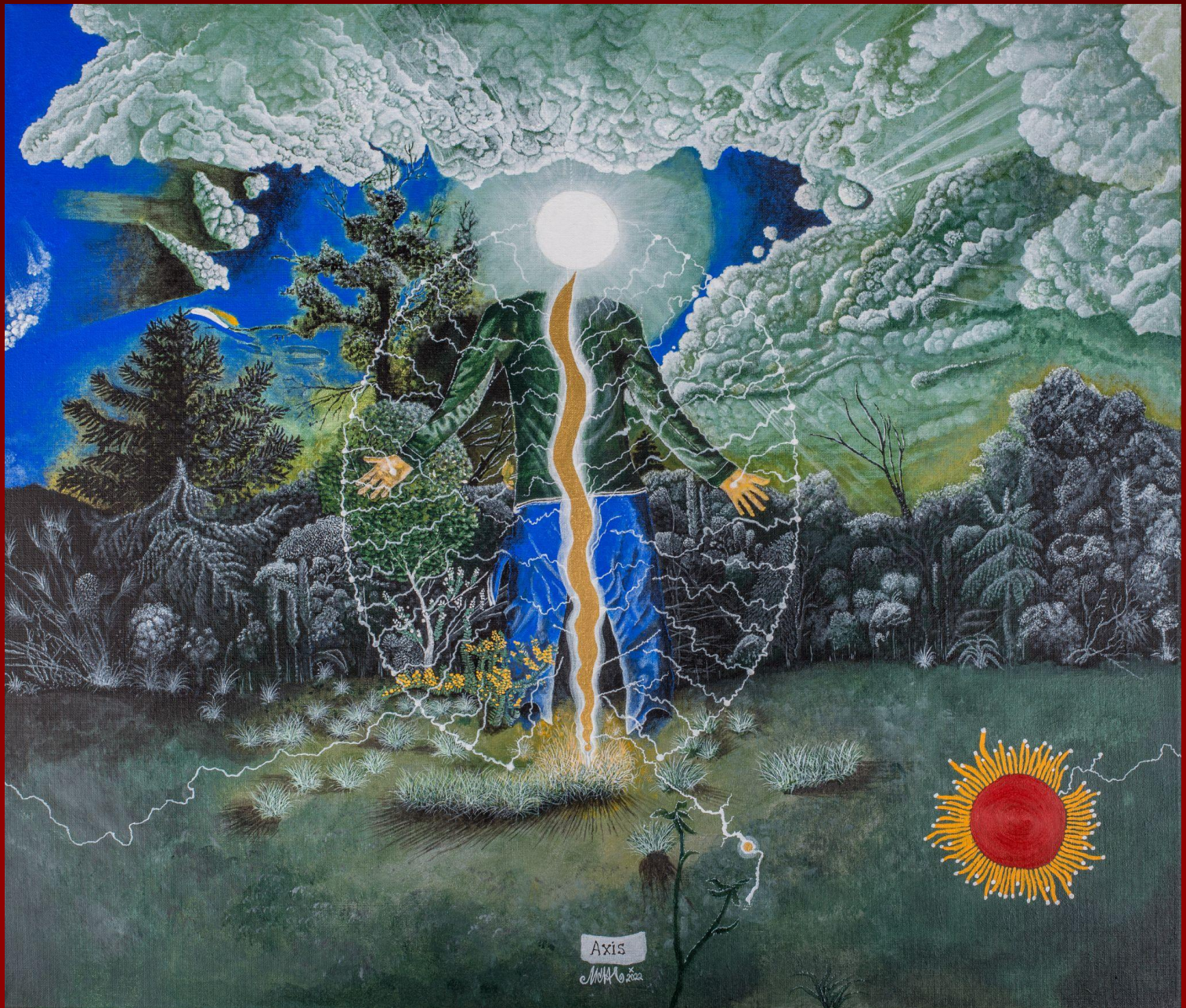
Tríptico "Hominis Secretum" "Silentium, Axis, Punctum Perceptio" Pintura acrílica sobre lienzo 240X70cm 2022 7.518€