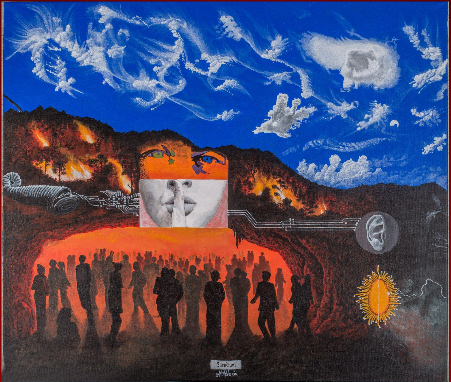
Tríptico "Hominis Secretum" "Silentium, Axis, Punctum Perceptio" Pintura acrílica sobre lienzo 240X70cm 2022 7.518€