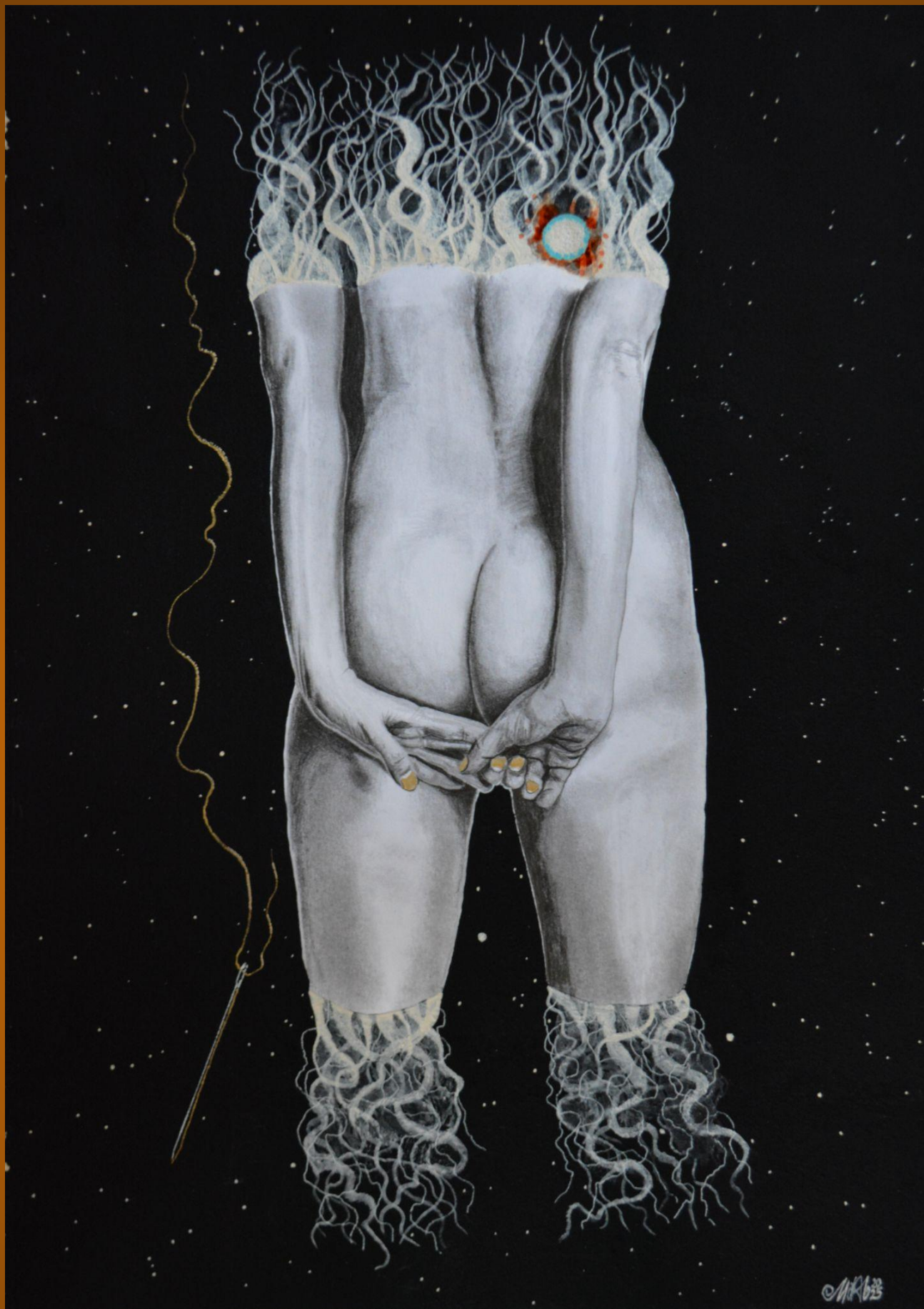
Colección Emanaciones de Urraca: Timidez {Συστολή} Lápices 4H, B, 3B, 8B, cartulina, pintura acrílica y acuarela, tinta roja, musou 99,4%, aguja y hilo. 40X30cm 2025 680€