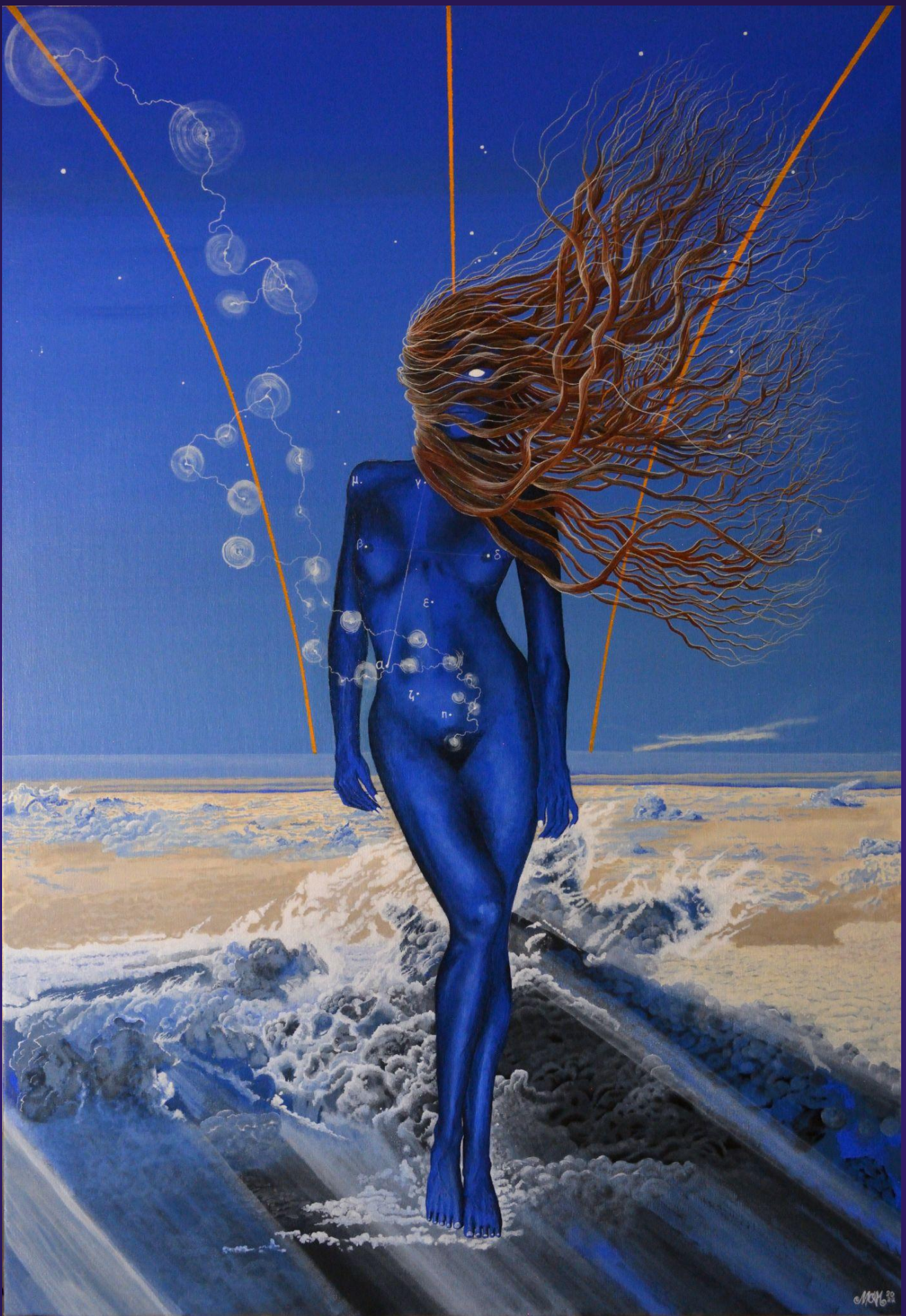
Femina Auster – Mujer Viento Sur Pintura acrílica sobre lienzo 81 X 116cm 2022 3180€