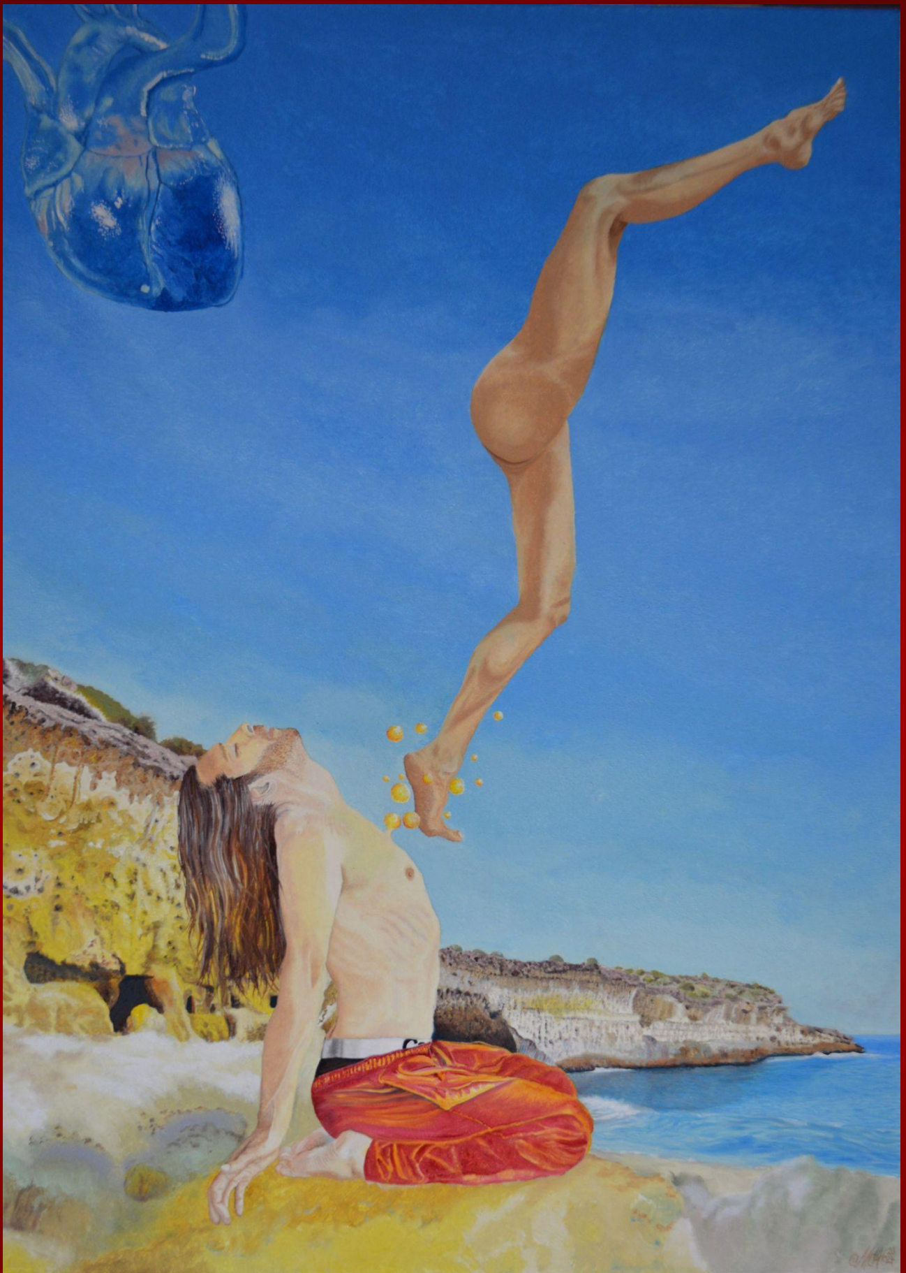
"Me gustas más cuando caminas con tu corazón" Óleo sobre lienzo 50 X 70cm 2024 1288€