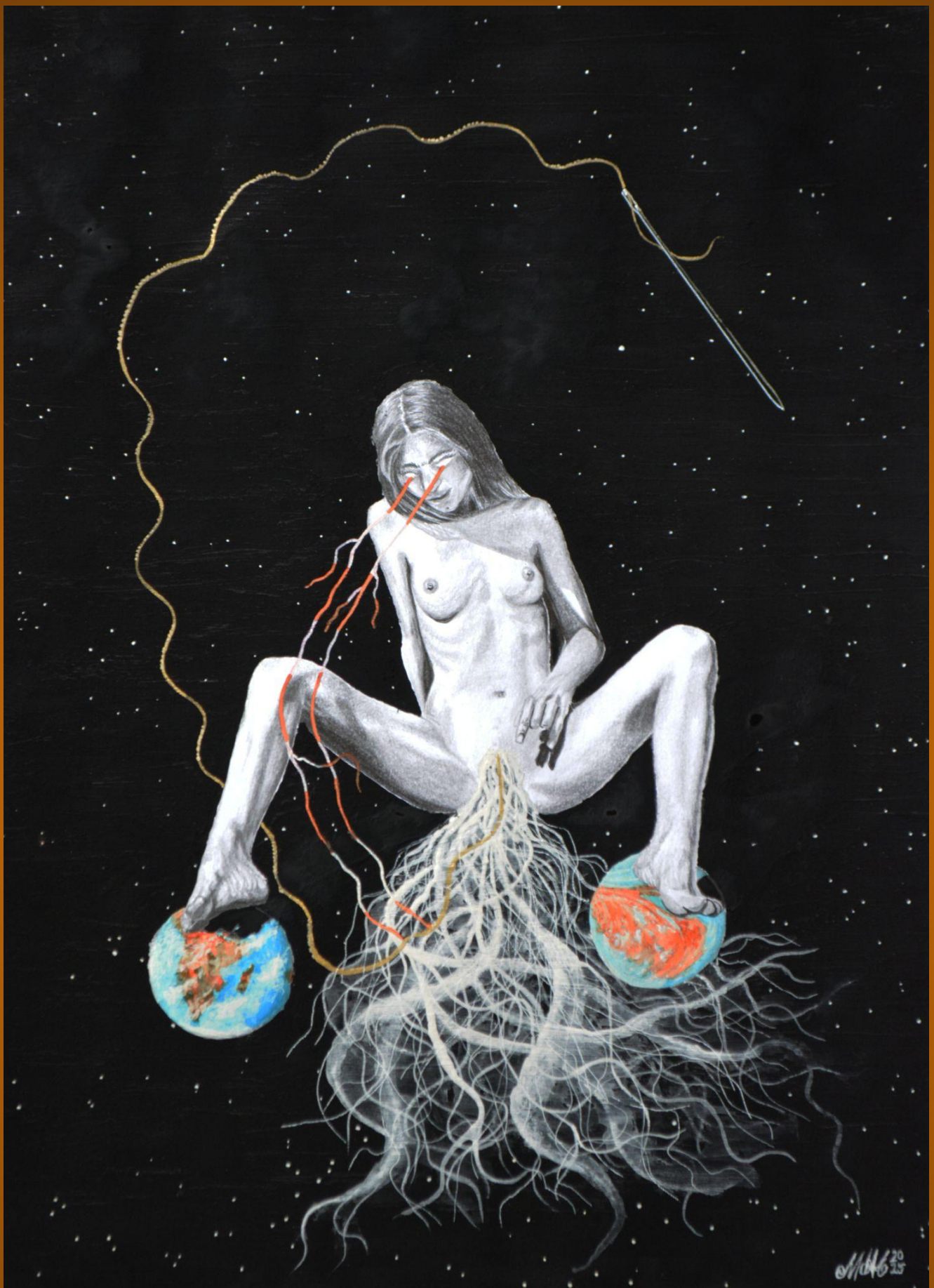
Colección Emanaciones de Urraca: "Mujer Despierta" {Η γυναίκα ξυπνά} Lápices 4H, B, 3B, 8B, cartulina, pintura acrílica y acuarela, tinta roja, musou 99,4%, aguja y hilo. 40X30cm 2025 1048€