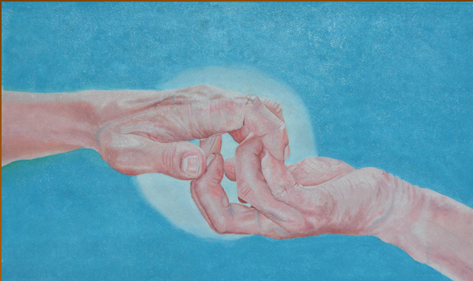
Dar y Recibir Óleo sobre cartulina 52 X 37cm 2024 680€

Actuamos con la ilusión de recoger las ganancias, siempre pidiendo algo a cambio... siempre estamos arrastrados con la corriente de la imaginación. Nos masturbarnos continuamente con el interés personal. No movemos un dedo si no hay beneficios.