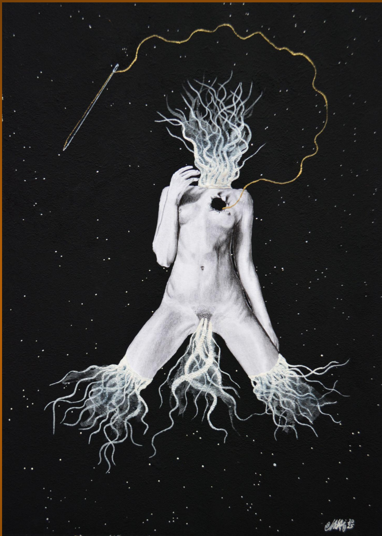
Colección Emanaciones de Urraca: "El corazón no se puede robar, se pierde" Lápices 4H, 2B, 4B, cartulina, pintura acrílica y acuarela, musou Black 99,4%, aguja y hilo. 40X30cm 115€