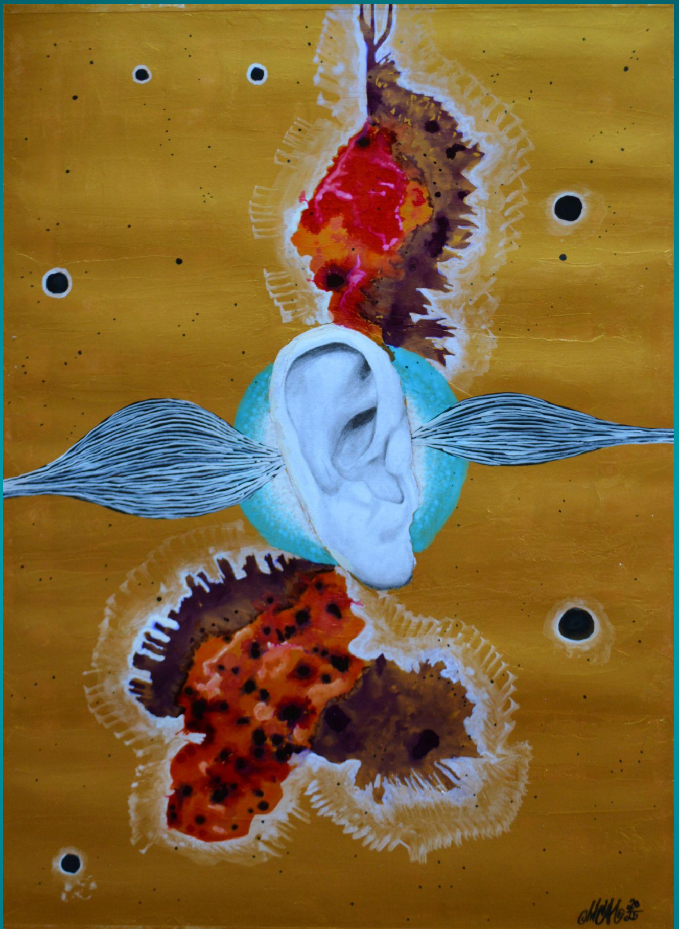
Colección Emanaciones de Mirlo: "Con las alas de Oído Interno" Lápices 4H, 2B, 4B, cartulina, pintura acrílica, aguja y hilo, silencio, oro, tinta púrpura y flamenco, acuarela blanca, estrellas negras. 30X40cm 549€