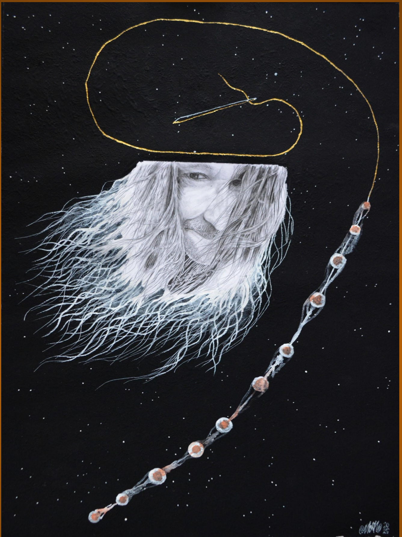
"El sitio donde no hay compasión" Colección: "Emanaciones de Urraca"

Lápices 4H, 2B, 4B, cartulina, pintura acrílica y acuarela, musou Black 99,4%, aguja y hilo, tinta naranja.