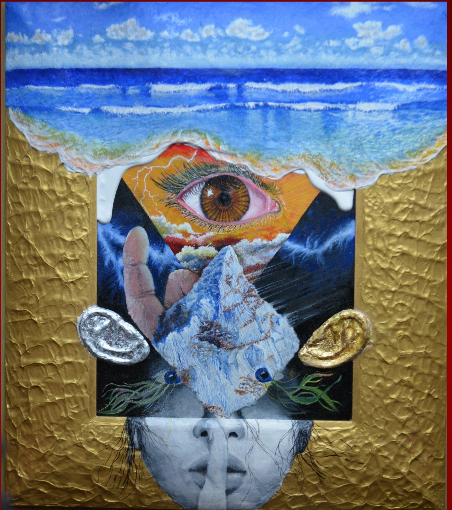
"Fragancia" Óleo sobre la tabla de madera 39,5 X 45,5cm 2024 1125€