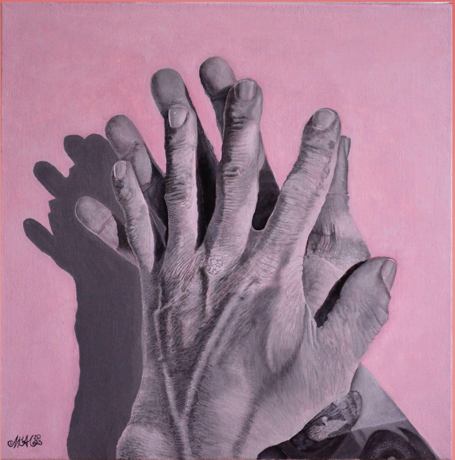
El Conocimiento es un placer" ( Scientia est voluptas ) Óleo sobre lienzo 40 X 40cm 2023 1448€