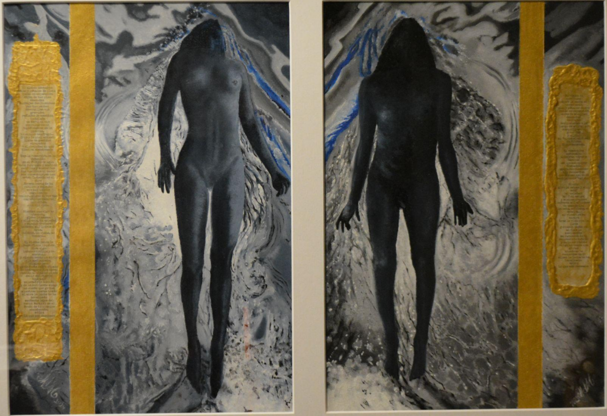
La Piscina C6smica: "Tu en la piscina y Yo no s6 sé si vengo" "La final... entr6 en la piscina, pero t6 t6 ya no estabas" 6leo sobre cartulina 72,5 X 55cm 2024 11146