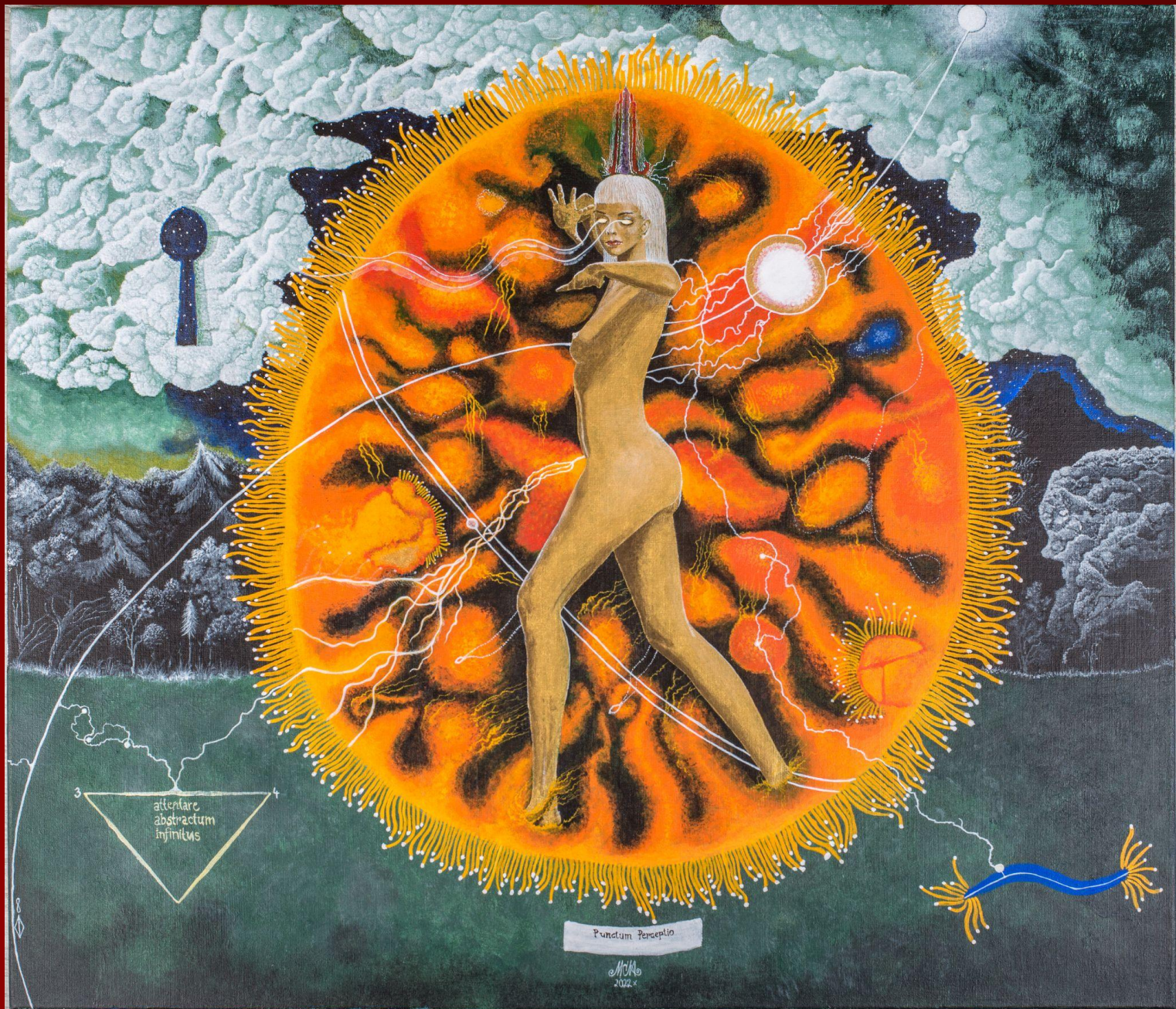
Tríptico "Hominis Secretum" "Silentium, Axis, Punctum Perceptio" Pintura acrílica sobre lienzo 240X70cm 2022 7.518€