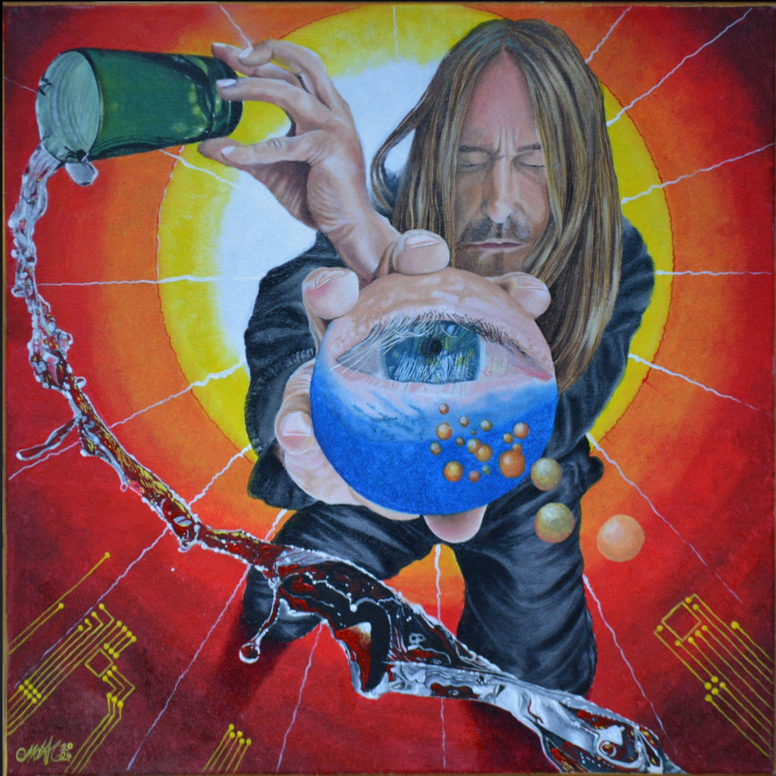
Pathos (πάθος, 'sufrimiento') "Afecto vehemente del ánimo" Óleo sobre lienzo 40 X 40cm 2024 1212€